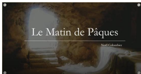
" Pâques " de Noël Colombier chanté par Noël Colombier