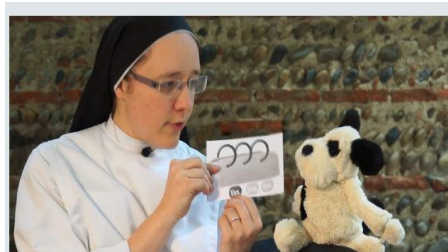
La question de Théobule

Pourquoi Jésus ne ressuscite que le 3ème jour ?