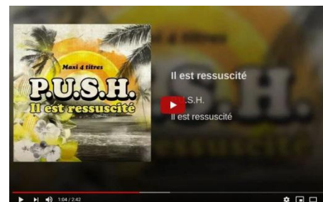
" Il est ressuscité " "