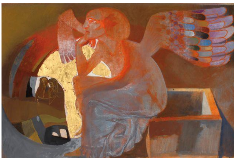
"Au tombeau 2 femmes" - Arcabas

Voici la nuit où la lumière déchire les ténèbres, voici la nuit de la promesse qui s'accomplit, voici la nuit qui fait renaître et grandir en enfants de Dieu. Quittons nos robes de tristesse, revêtons la clarté du jour : Christ est ressuscité des morts, Christ est la vie, célébrons sa Pâque dans la joie.